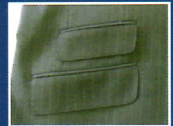
■チェンジポケット