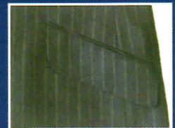
■ハッキングポケット