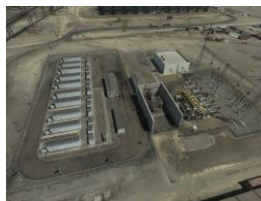
チリ共和国コ克蘭石炭火力発電所

※1 チリ共和国で発電容量第二位の発電事業者であるAES Gener社(三菱商事株式会社)が同国北部第II州メヒョネス郊外に建設した発電容量net 47.2万kW / gross 53.2万kWの発電所。